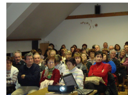
Četrtekovi večeri v Cerknici