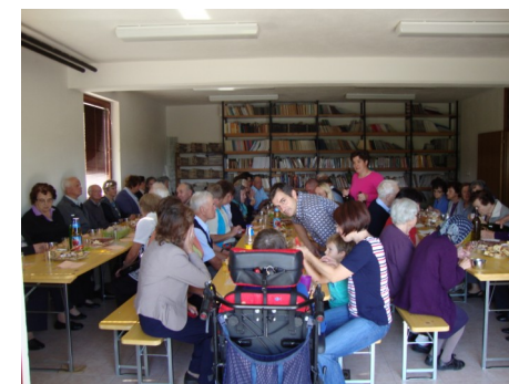
srečanje ostarelih leta 2013