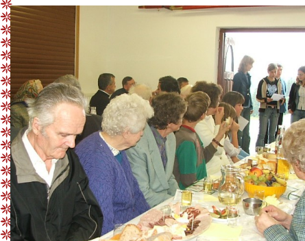
pogostitev in nastop mladih pevcev leta 2009