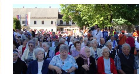
Skupina naših romarjev na Brezjah